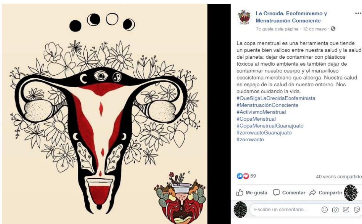
Imagen 3. La Crecida. Ecofeminismo y menstruación consciente (12 de mayo de 2019). Recuperado de: https://www.facebook.com/LaCrecida/photos/a.930326520378080/2474207235989993/?type=3&theater