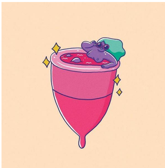
Imagen 5. Andonella [@Andonella] (2018, 22 de febrero). Copita menstrual [foto de Instagram]. Obtenida de: https://www.instagram.com/p/Bfgp52KgPGd/

Es frecuente que a la par de discursos, imágenes y textos sobre la apropiación corporal, las artistas publiquen en sus redes ilustraciones, viñetas y dibujos de copas menstruales y de úteros en diversas presentaciones, colores y acciones, incluso dotándolos de carácter y personalidad (imagen 5). Estas formas estéticas y sus creadoras, si bien pueden no pertenecer a un movimiento articulado de activismo o ciberactivismo menstrual, sí contribuyen a la visibilización y normalización de la menstruación, de la anatomía femenina y de productos que imprimen a la experiencia menstrual un carácter personal, distinto, vivencial e incluso divertido.