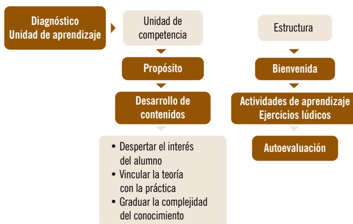
Figura 1. Esquema del proceso del diseño de Módulos Integrales de Aprendizaje.

A continuación se presenta el esquema (figura 1) y el flujograma (figura 2) del proceso de desarrollo del MIA. En éste último se muestra la participación de las instancias y actores involucrados en esta actividad, que comprende a docentes de las escuelas preparatorias, así como a pedagogos, diseñadores gráficos, comunicadores, psicólogos educativos e ingenieros en sistemas que colaboran en la Dirección General de Educación Continua y a Distancia de la UAEM a través de dos direcciones: la Dirección de Normas y Evaluación de Modelos Educativos, que ofrece asesoría didáctico-comunicativa a los docentes, y la Dirección de Tecnologías para la Educación, que realiza el diseño web de los MIA.