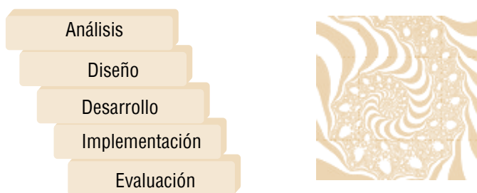
Figura 2. Representaciones del modelo convencional y del modelo contextual de diseño instruccional.

Mientras los modelos convencionales de diseño instruccional a menudo estructuran la planificación de la enseñanza-aprendizaje en etapas distintas (análisis de necesidades y definición de objetivos; diseño y desarrollo de los materiales instruccionales; implementación del evento o situación de enseñanza-aprendizaje, y evaluación del sistema propuesto), en la educación en red la implementación de la situación didáctica no se da separada de la concepción (etapas de análisis, planificación y producción), sino que progresa a través de una serie de etapas de manera dinámica (modelo fractal), según nos muestra la figura 2.